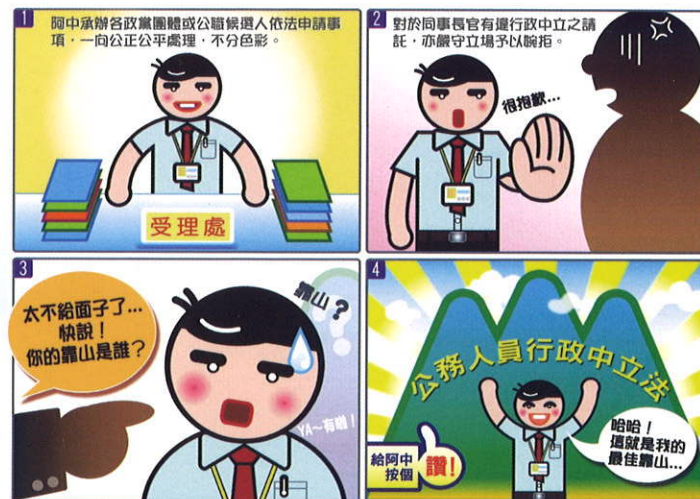
行政中立圖稿徵選比賽「創意漫畫」第一名得獎作品