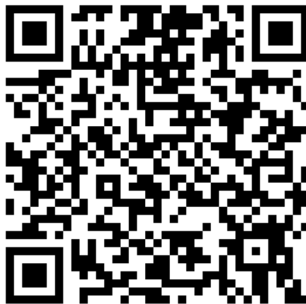
中心官方 Line QR Code