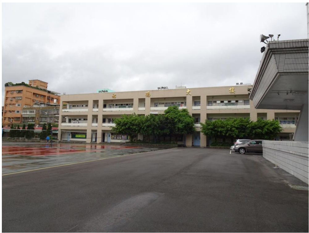
(1) 外觀與 周遭環境