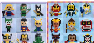
(創意積木示意圖，隨機給款)