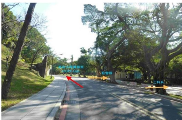
4 野台(小吃部旁)→駐警隊