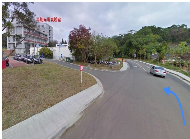
4.南校區廢水處理廠 →左轉 奕園停車場