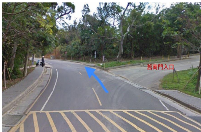
2. 育成創新大樓→ 舊南門入口