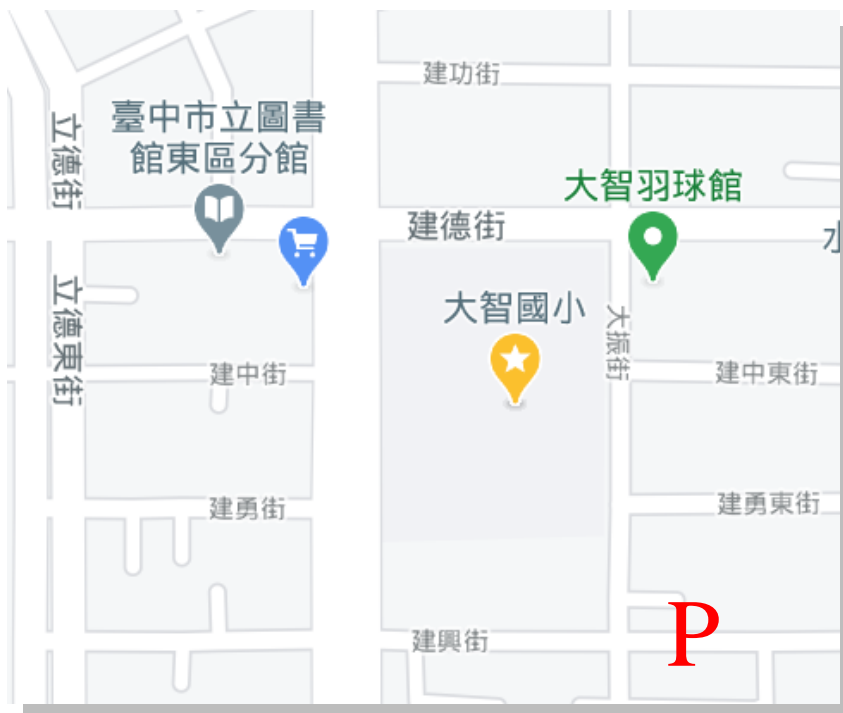
大智國小教室配置圖