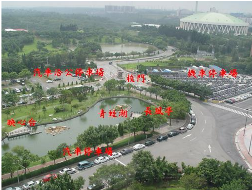
(長庚大學校區平面停車場)