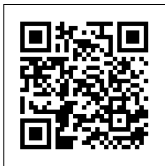
一般報名 QR code

https://forms.gle/KTgXh7vhninYcq39 )，即日起至 4 月 30 日下午五點以前完成報名（現場報名人數上限預定為 250 人）。