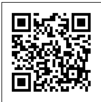
學術論文投稿報名網址 QR code