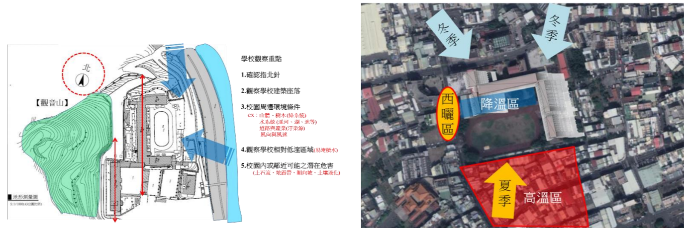
上圖 校園外環境盤點分析