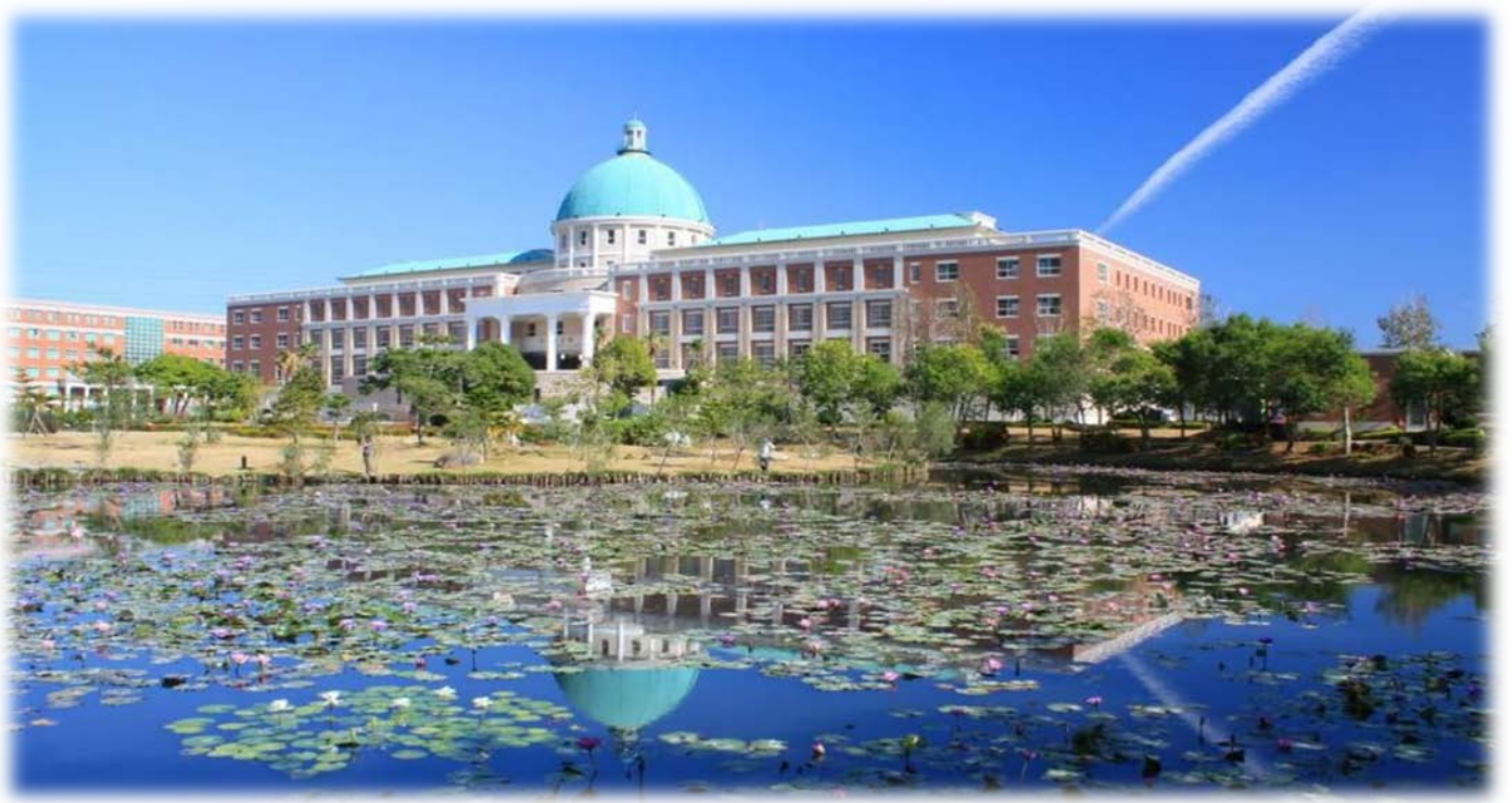
圖：就讀亞大，宛如就讀一所「綜合大學」+「醫學大學」+「國際大學」