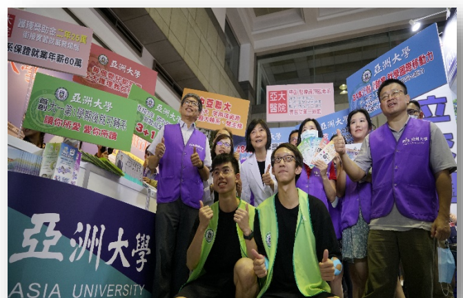
圖：招生處行政團隊參加大學博覽會