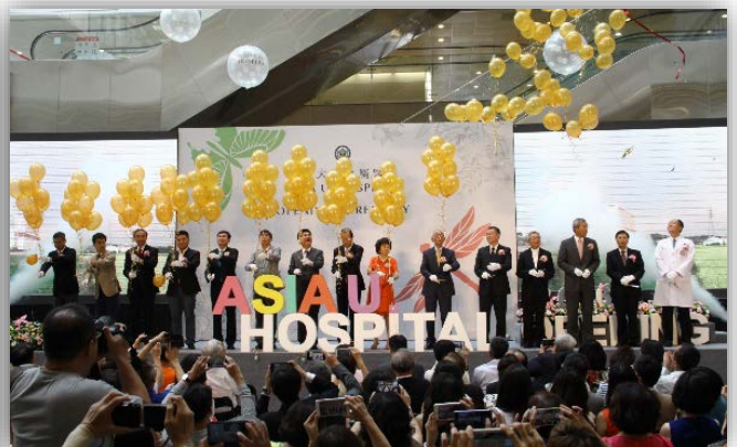
圖：亞洲大學附屬醫院