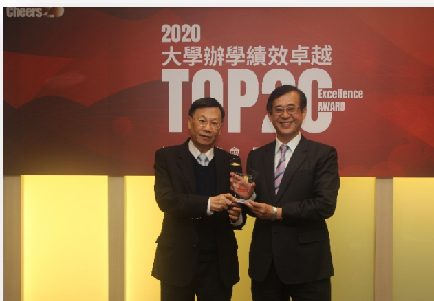
圖：大學辦學績效 TOP20，全台第 9 名！