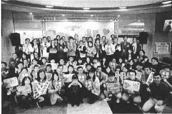
▲台積電舉辦台積電愛心市集。