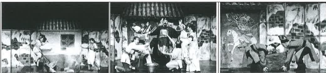
觀眾愉悅觀賞活動