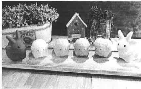
埔里國中 707 班同學捐贈的小羊撲滿。