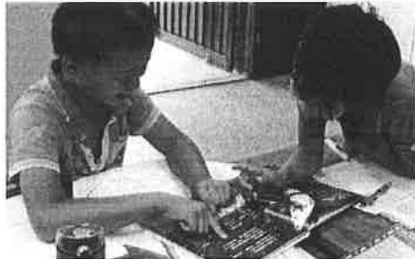
參加閱讀寫作營隊的孩子，分享、討論繪本裡的故事情節。