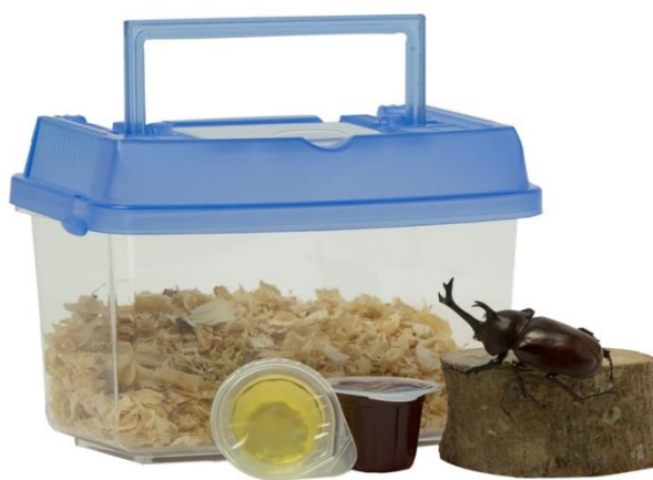
甲蟲飼養(暑假贈品)