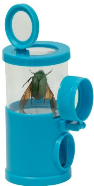
昆蟲放大觀察盒組