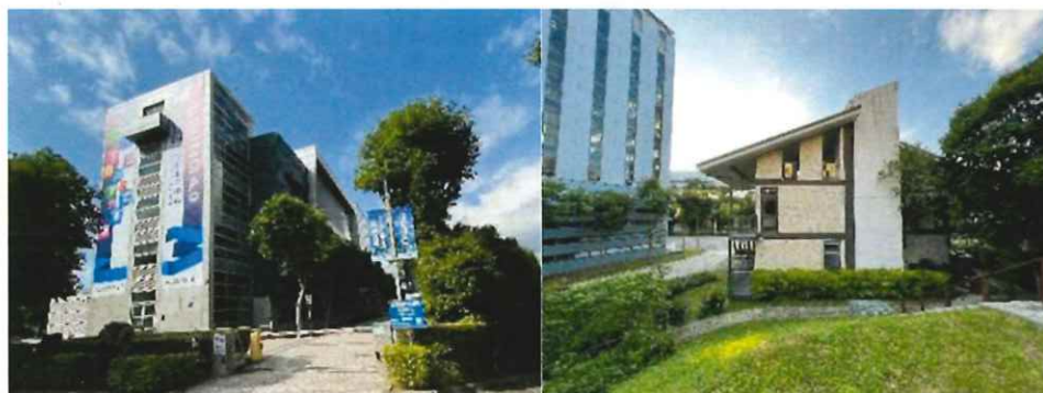
圖：智慧化居住空間案例導覽觀摩預定解說場域

透過這樣的導覽解說，學員將有機會實際觀看並體驗智慧生活科技與節能系統的應用相貌。他們將能夠了解智慧化居住空間展示中心中不同場景的設計概念、智慧設備的運作原理以及它們對生活的影響。這樣的實際觀察和體驗有助於學員更深入地理解智慧科技在居住空間中的應用，並激發他們對科技創新的興趣和想像力。