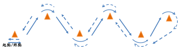
盤球測驗(每位考生盤球來、回S型測驗秒數)