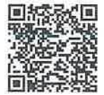
教案教學活動表單