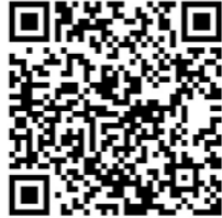
智慧化校園餐飲服務平臺小幫手

(三) 若有報名課程的午餐負責人在課前應確認並備妥之帳號綁定所需資料，以便課程進行順利：