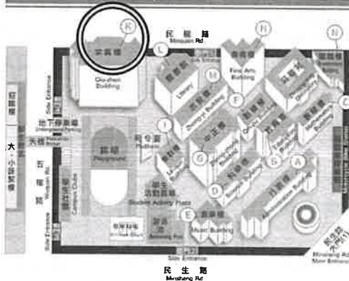
國立台中教育大學 民生校區 全區導覽圖 National Taichung University of Education Minsheng Campus Floor Plan