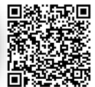
地圖 QR code