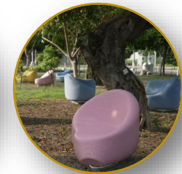
6. 《水滴客廳·環生座椅》