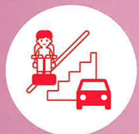
上下樓梯與交通問題