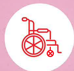
行動問題與如何坐的好