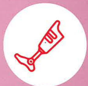
義肢矯具護具鞋墊