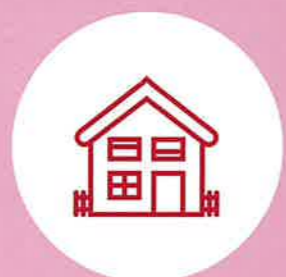
居家自立生活好幫手