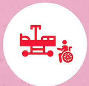
照顧與轉移位好辛苦