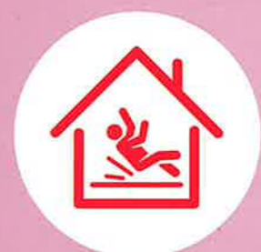
居家無障礙住宅裝修