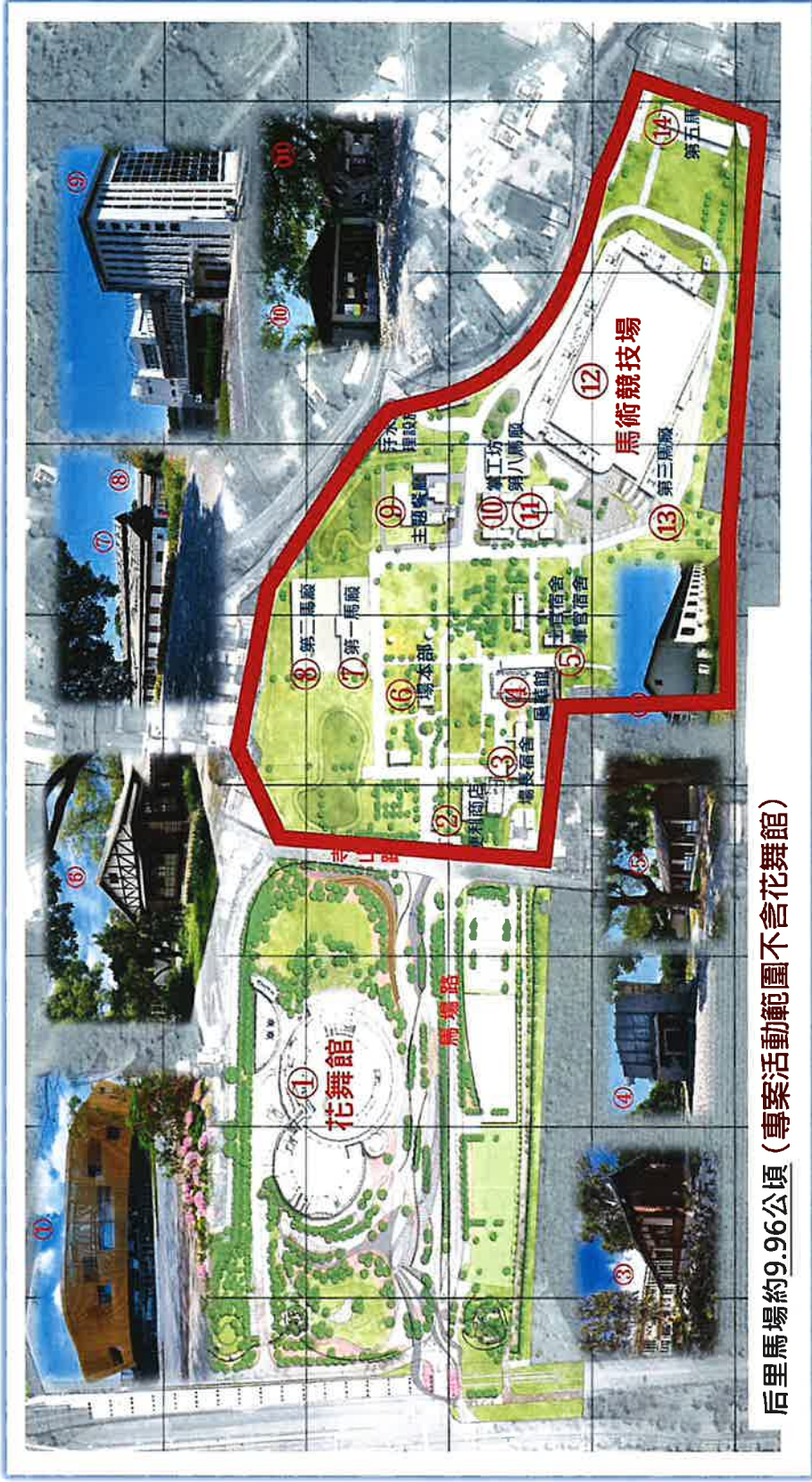
后里馬場約9.96公頃（專案活動範圍不含花舞館）